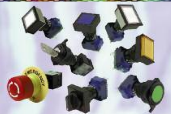
Baureihe 61 - 16mm