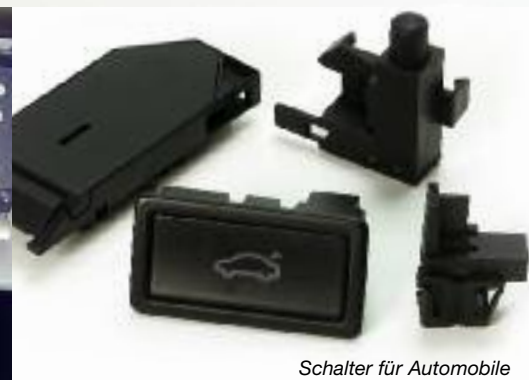
Schalter für Automobile